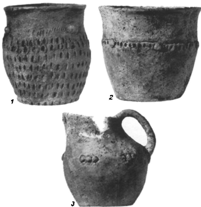
Fig. 3. — 1, vas din M 12; 2, vas din M 13; 3, vas-askos din M 13.

Subgrupa II b include mormintele 8, 11, 13, 16, 18, 20, 24, și probabil, 26. Mormintele sînt de asemenea caracterizate prin existența camerei mari, superioare, a treptei și a camerei mortuare, mai redusă ca dimensiuni. Deși în nici un caz nu s-au păstrat birnele înșile, există indicii serioase care acordă suficiente temeiuri părerii că acestea au existat la vremea lor, sprijinindu-se de treaptă și acoperind camera mortuară. Elementul deosebit al subgrupelor este acela că morții din II b sînt inhumati, față de movila mare, existentă anterior lor, în sens invers sensului acelor ceasornicului (și de această dată socotit tot dinspre picioare spre capul mortului). Orientarea este variată, observîndu-se o anumită grupare a lor în pîlcuri, acestea din urmă dispuse, la rîndul lor, evident în jurul movilei. Toți morții erau chirciți lax (excepție M 11, puternic chircit; de altfel și mormîntul lui e de un tip diferit, figura 1), fiind depuși pe partea stîngă, pe un așternut. Ocrul era utilizat în felurite chipuri: presărat în anumite zone