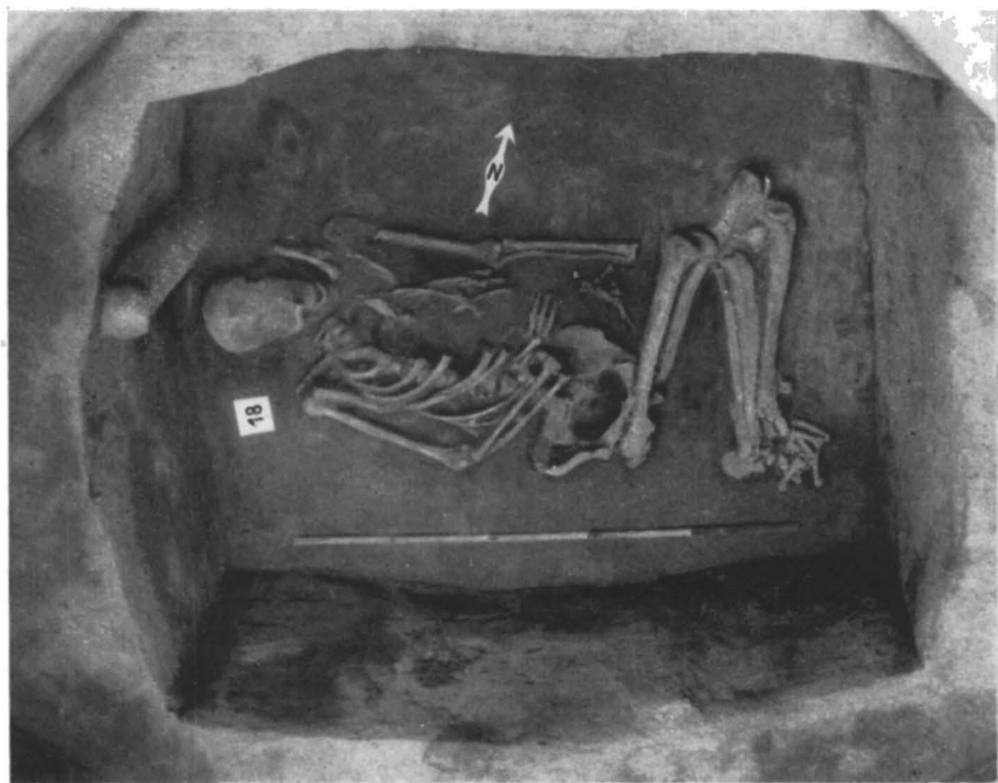
Fig. 4. – Scheletul din M 18. Groapa reprezintă camera mortuară.

Doar două morminte aveau inventar, aflat întotdeauna la nivelul treptei, dar nu